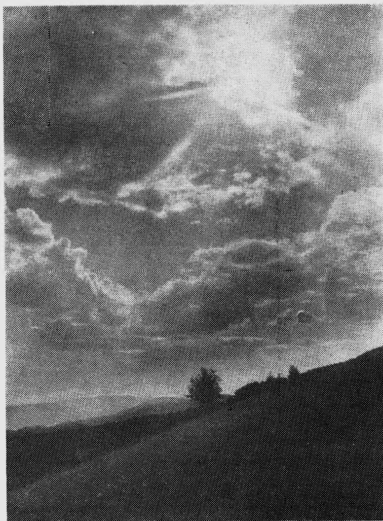
ФОТОКОНКУРС «ПОЛИТЕХНИК»-76. Перед бурей.